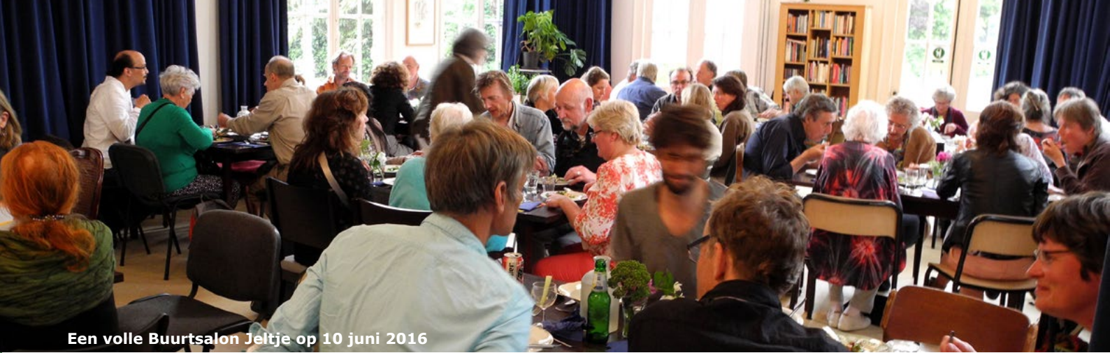
Een volle Buurtsalon Jeltje op 10 juni 2016