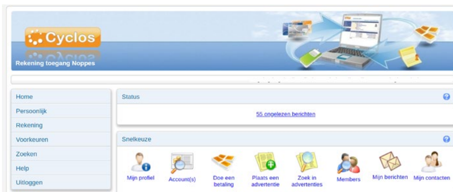
Interface van Cyclos 3.x

Cyclos maakt het voor de leden mogelijk betalingen te doen, en om persoonlijke info en advertenties te beheren en deze met andere leden te delen. Het bestuur kan een goed inzicht krijgen in de interne handel van de kring met de rapportages .